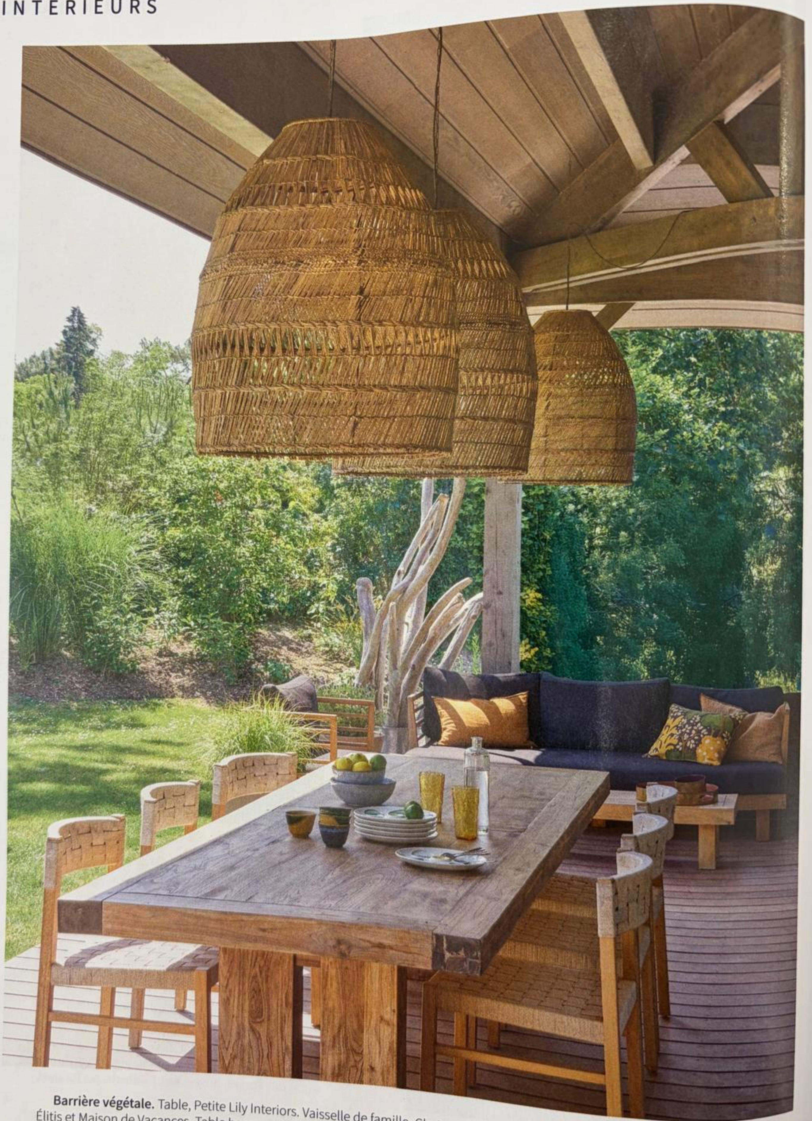
Barrière végétale. Table, Petite Lily Interiors. Vaisselle de famille. Chaises « Cora » et canapé « Strauss », Dareels. Coussins, Élitis et Maison de Vacances. Table basse en bois flotté rapporté de la plage de Ramatuelle. Suspensions « Shezad », Zoco Home.